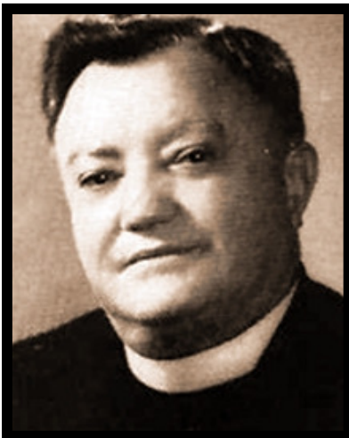
Pr. Grigore Coste